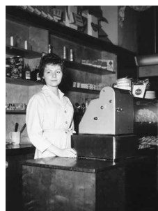
Birgittas extrajobb på kondis Angle på Kungsholmen