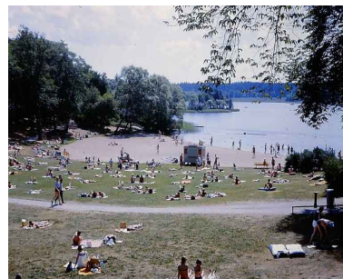
Ängbybadet, mitten av 1960-talet