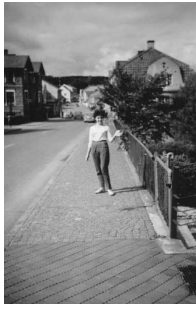
Birgitta vid Norrtäljeån