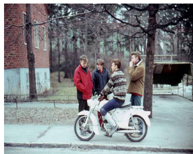
Utanför skolans personalbostad