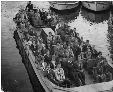
Utflykt med Paddan juni 1955

Skolresa till Göteborg med klasserna 7-8 Ulvsunda folkskola