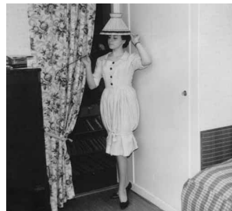
Hemma - Birgitta har roligt