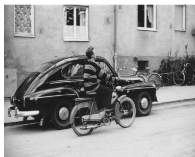
Roland på moped